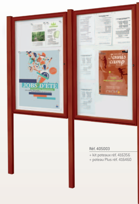
Réf. 405003 + kit poteaux réf. 416356 + poteau Plus réf. 416460