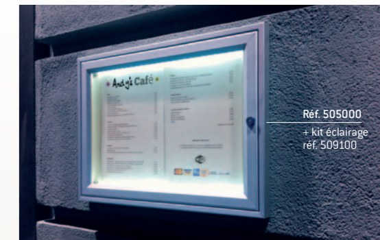
Réf. 505000 + kit éclairage réf. 509100