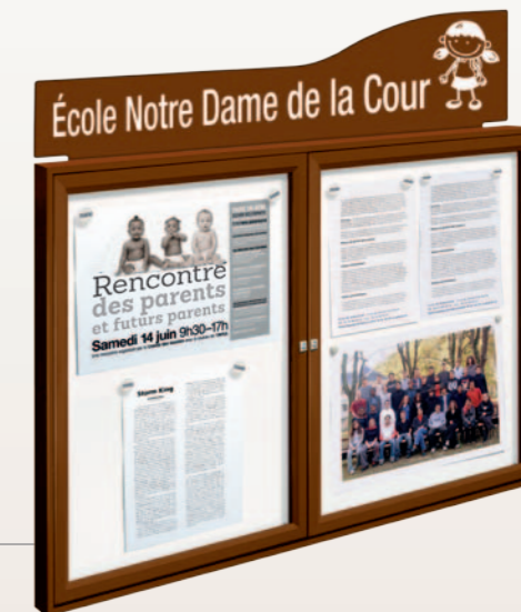
Réf. 405075 + bandeau Oceanic réf. 409015